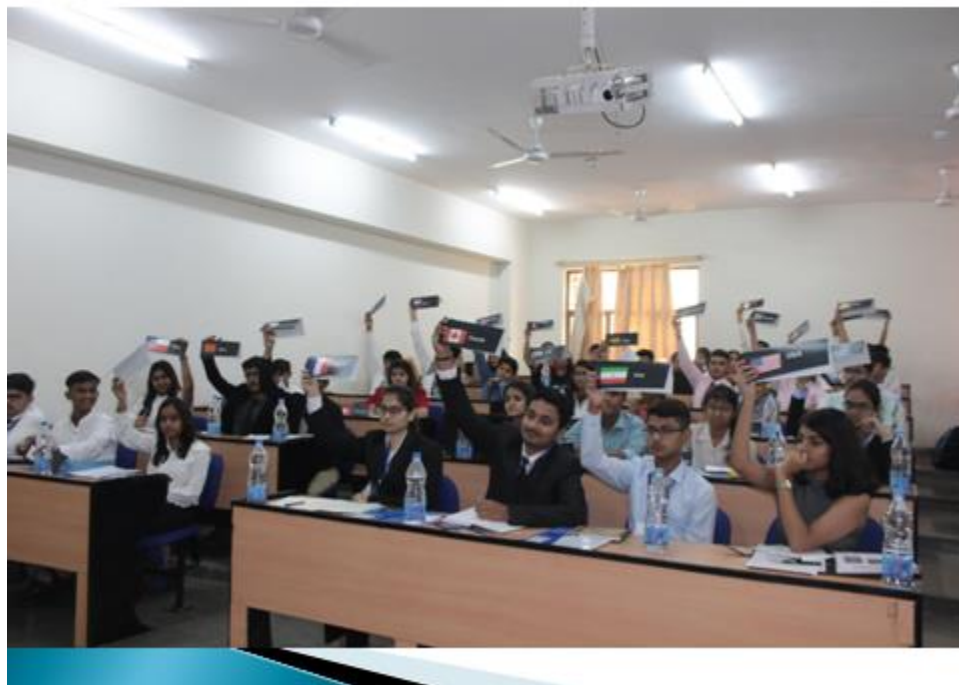
UNHRC discussing agenda