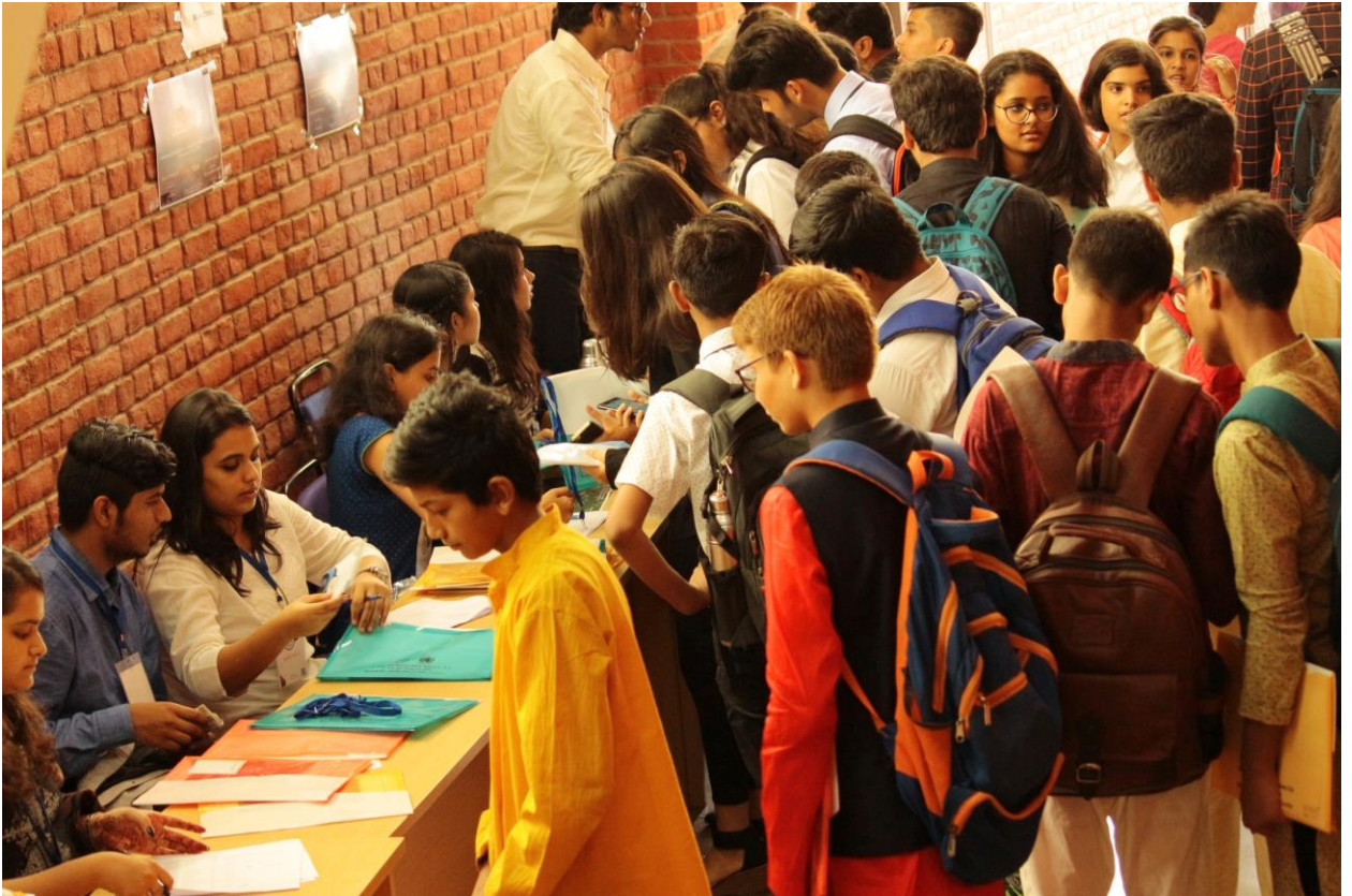
Registration of students on 27 th August 2018