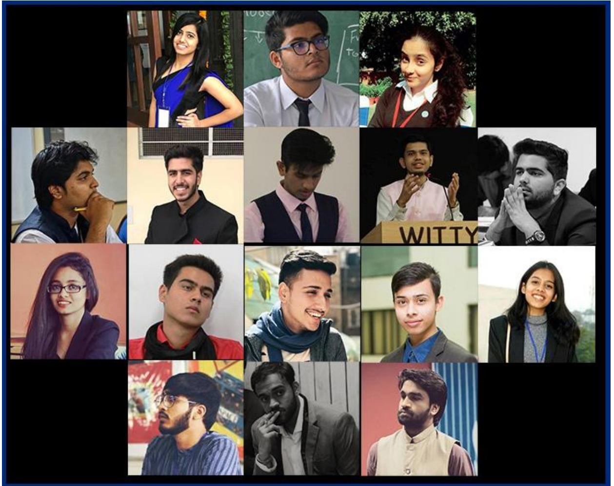
EXECUTIVE BOARD MEMBERS OF MUN