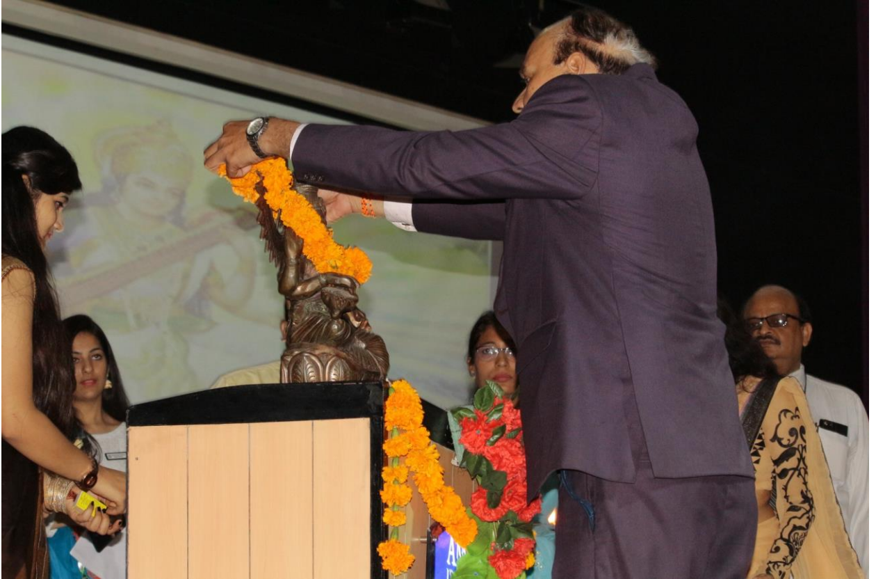
Lightening of lamp by Director ALS