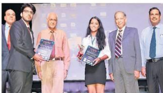
मॉडल यूनाइटेड नेशंस के विजेता प्रतिभागियों को पुरस्कार देने अतिथि।