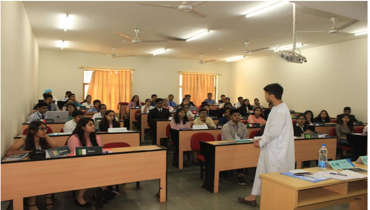
Committees discussing agenda UNGA