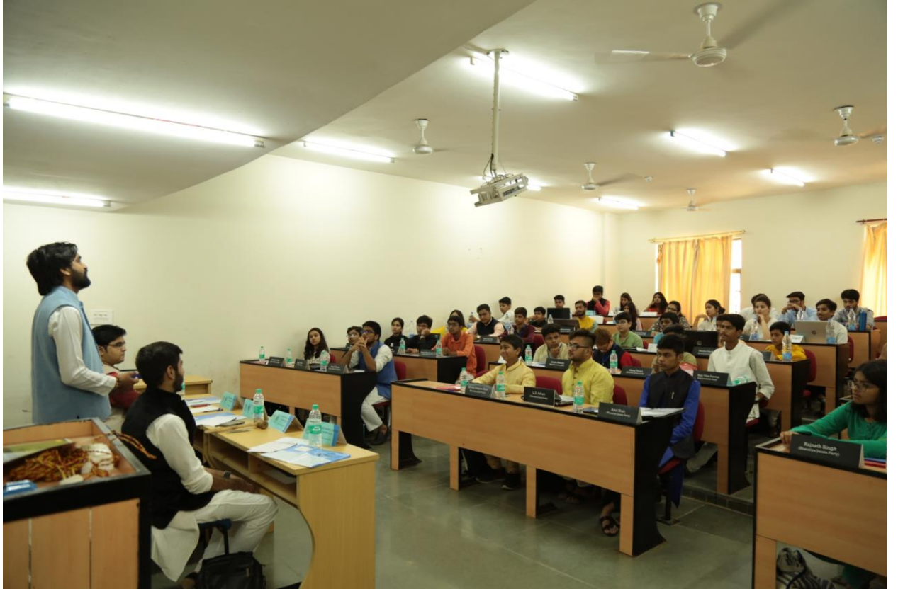
LOKSABHA discussing agenda